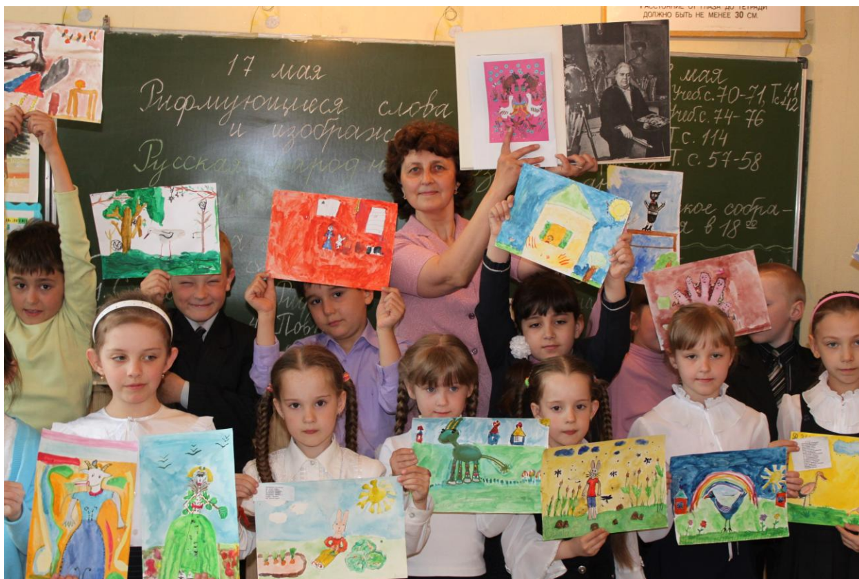
Иллюстрации учащихся 1 Б класса к малым фольклорным жанрам

Учитель: - Давайте сделаем выставку рисунков. Это ваш первый опыт применения приёмов народного искусства.