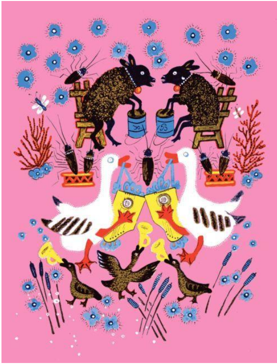
Ю.Васнецов «Музыканты» 1964г.

Учащиеся (высказываются по очереди, а тот, кто заметил то же самое, делает 1 хлопок в ладоши):